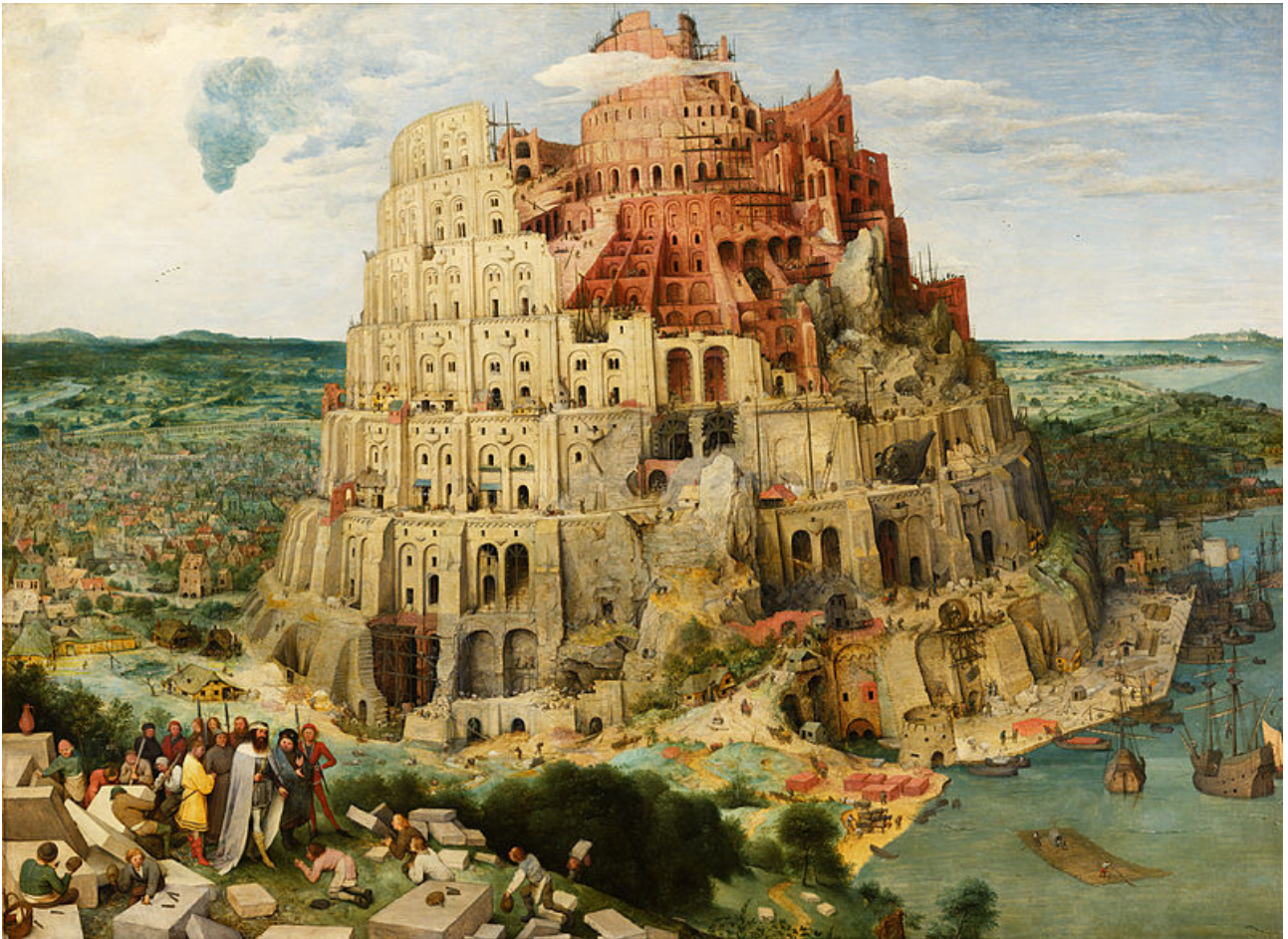
La Grande tour de Babel par Pieter Brueghel l'Ancien (vers 1563), huile sur bois, 114 x 155 cm, Kunsthistorisches Museum, Vienne (Autriche).

J'ai décidé de publier ce post en Janvier 2022 car cette analyse est à l'aune des élections présidentielles toujours d'actualité. Sémiotips est un support que je partage à l'intention des passionnés de sens, des étudiants en communication ou des badauds, flâneurs et autres curieux, ces notes sont un partage qu'il me plaît de vous offrir. Bonne lecture.